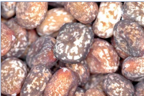
FIGURA 3. Llavors de Lupinus mariae-josephi.