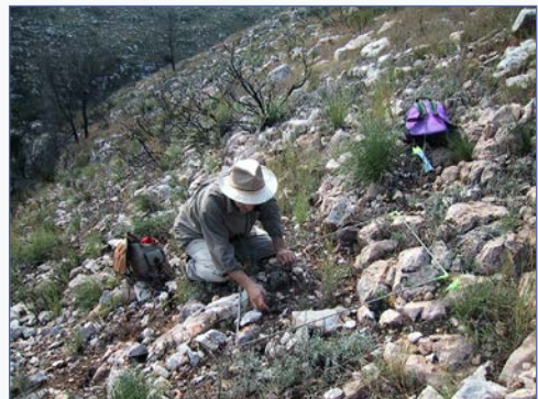
FIGURA 4. Treballs de cens de Lupinus mariae-josephi al pla del Tramussar (Xàtiva, València). Autor: Albert Navarro.

Seeds of Lupinus mariae-josephi . Author: Emilio Laguna.