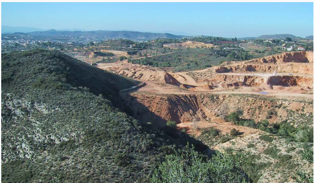
FIGURA 2. Lloc de la troballa original de la tramussera valenciana a Montserrat (València), actualment convertit en una pedrera.