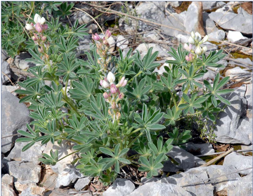
FIGURA 1. Exemplar de Lupinus mariae-josephae (lloma del Tramussar, Llombai, València). Autor: Simón Fos.

Els exemples inversos, en què els usos o coneixements tradicionals han estat un element bàsic per assegurar la conservació d'espècies rares o amenaçades, són menys cridaners i prou escassos a la literatura botànica. Els exemples documentats s'han centrat fonamentalment en el cultiu de plantes que havien anat desapareixent a la natura o en l'ús de la toponímia per a la cerca de poblacions de plantes amenaçades. La fitotoponímia, és a dir, la toponímia lligada al nom de les plantes, hi juga un paper decisiu, perquè sovint ha deixat al nostre territori la ressenya de llocs on van existir espècies ara desaparegudes, sempre en el cas que foren espècies útils, que, per tant, han tingut