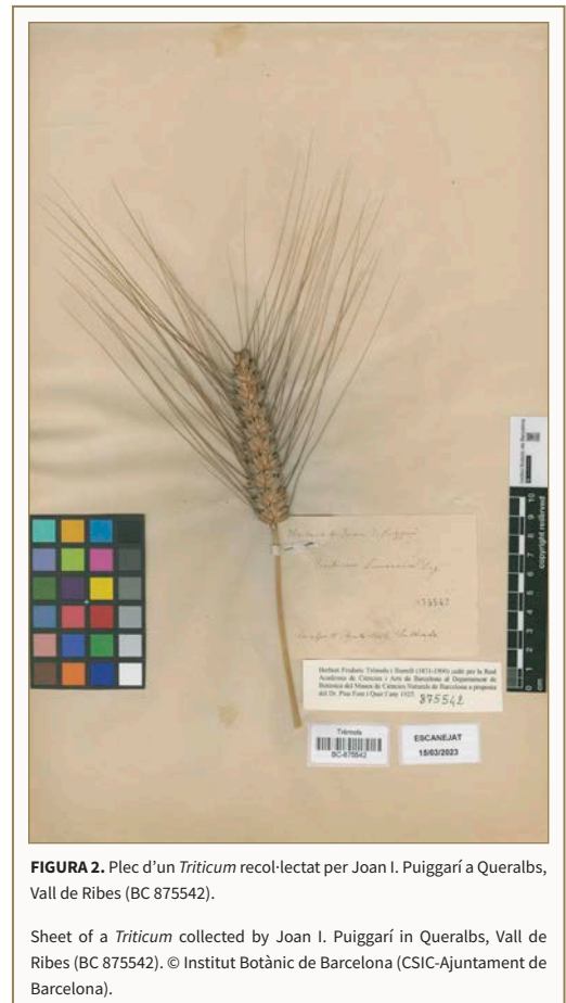
FIGURA 2. Plec d'un Triticum recol·lectat per Joan I. Puiggarí a Querals, Vall de Ribes (BC 875542).

Moltes d'aquestes recol·leccions s'han conservat a l'herbari BC de l'Institut Botànic de Barcelona. Recentment, gràcies a la digitalització de l'herbari Trèmols (herbari històric dins de l'herbari BC) feta per Laura